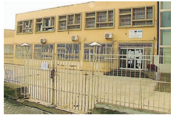
Porte chiuse ieri mattina alla "Giacomo Leopardi" di Minissale

Domani alle 13, presso i locali del refettorio dell'Istituto Michele Trimarchi (3. Istituto comprensivo) in via Mario Corso Orsino, si terrà la cerimonia di inaugurazione del servizio di refezione scolastica per le scuole materne, elementari e medie del Comune di Messina, svolto dalla ditta "La Cascina Global Service".