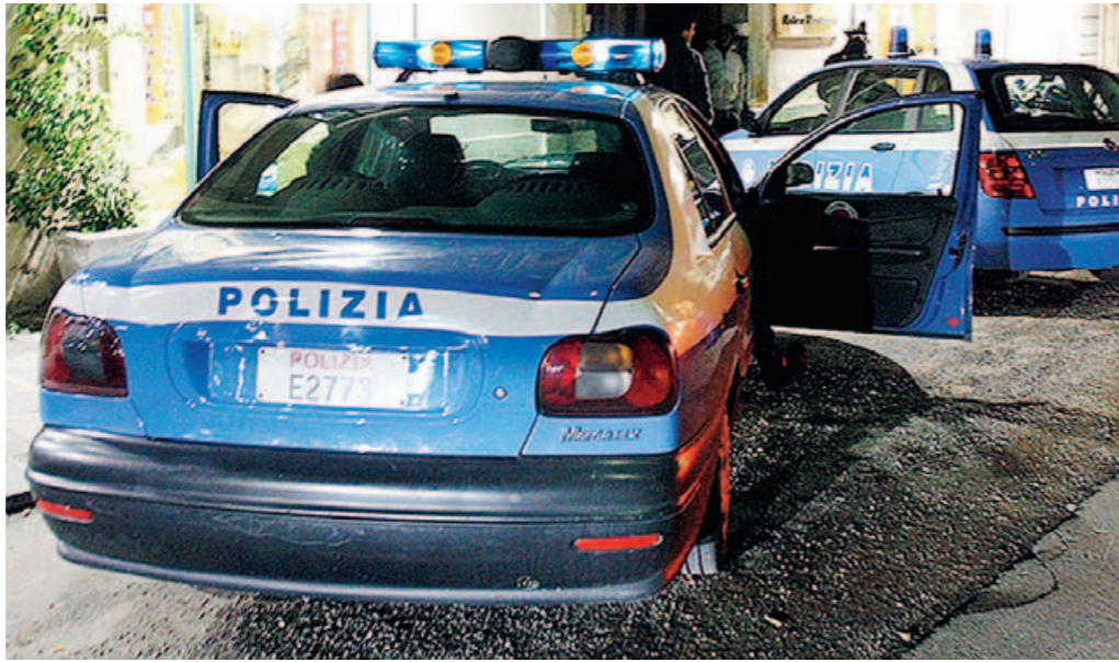
La polizia ha eseguito l'ordinanza di custodia cautelare in carcere emessa dal gip del tribunale

L'uomo ha palpeggiato, spintonato e gettato a terra la ragazzina che provava a liberarsi