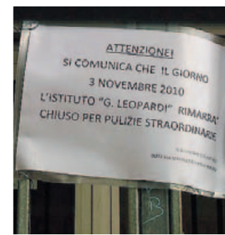
L'avviso affisso al cancello

Ma anche dal policlinico, pur arrivando conferme sul caso di meningite virale, giungono precisazioni tranquillizzanti sia sulle condizioni dell'uomo che sulle possibilità di contagio, ritenute praticamente nulle dai medici. ◀ (s.c.)