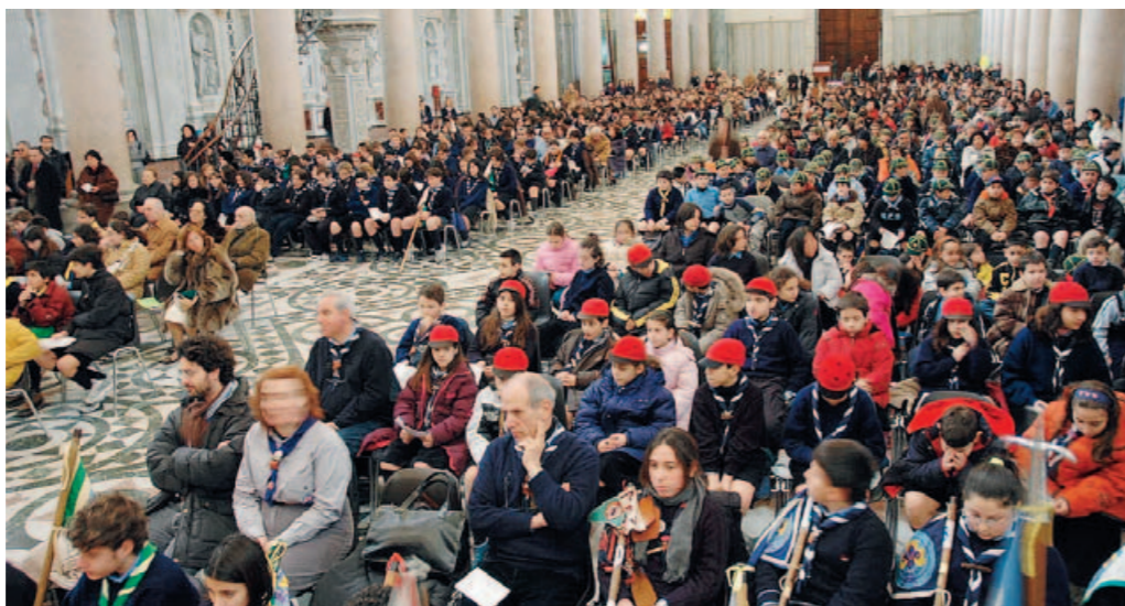
In una foto d'archivio la Giornata degli scout celebrata in Cattedrale

E proprio per celebrare questo avvenimento e rendere omaggio ai pionieri dello scoutismo messinese, il Comitato promotore del centenario dello scoutismo in Sicilia, promosso dal Centro studi e documentazione, d'intesa con le associazioni scout presenti nell'isola, organizza nella città dello Stretto un convegno regionale di studi, che si svolgerà giovedì 11 alle 16 nell'auditorium del Palacultura "Antonello da Messina", dal titolo "La pedagogia attiva dello scoutismo nella società contemporanea per la formazione del buon cittadino". I dettagli sull'iniziativa, patrocinata dal Comune, dal Cevs e dall'Associazione maestri cattolici, sono stati resi noti, nel corso di una conferenza stampa tenutasi nel Salone delle Bandiere di Palazzo Zanca, dall'assesso-