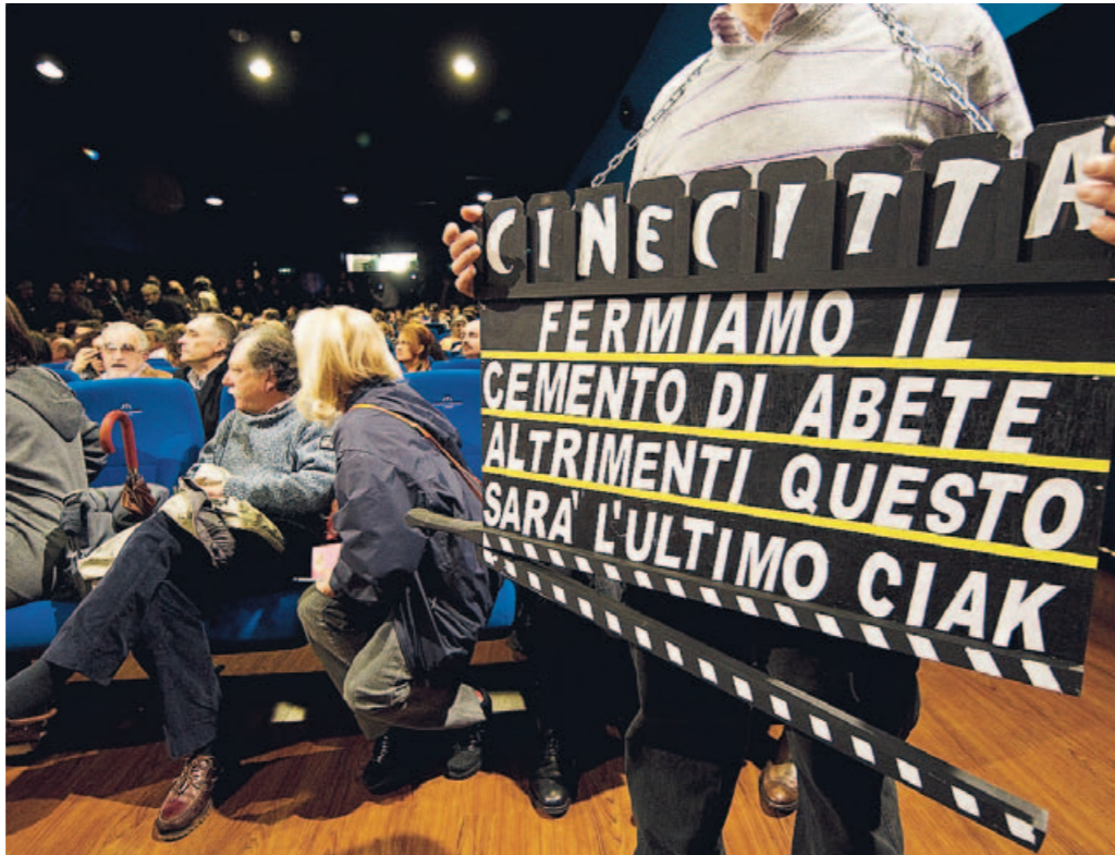
Un momento della manifestazione dei lavoratori dello spettacolo al cinema Adriano di Roma

Pur essendo tra i principali bersagli della protesta, il ministro dei Beni Culturali, Sandro Bondi, ha detto: «Non posso non comprendere le ragioni della protesta del mondo dello spettacolo che, nonostante certe strumentalizzazioni politiche, pone problemi