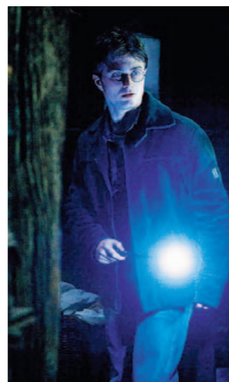
Daniel Radcliffe è Harry Potter

«Noi credevamo», il film risorgimentale di Mario Martone, al centro di un caso polemico per il numero di copie di uscita è protagonista di un piccolo miracolo: dal 15. posto della scorsa settimana,